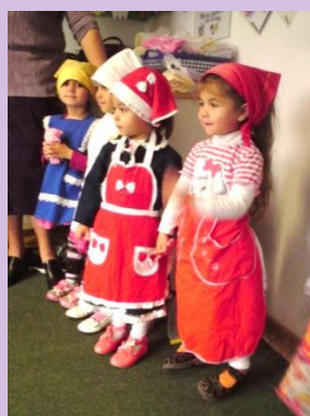
Moederdag op de kleuterschool