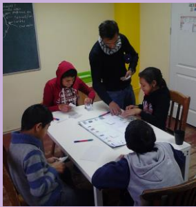
Leren omgaan met geld