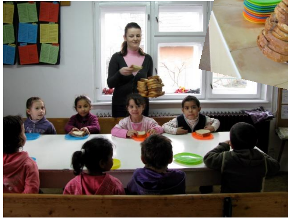
Als ze moeten wachten tot de lessen beginnen